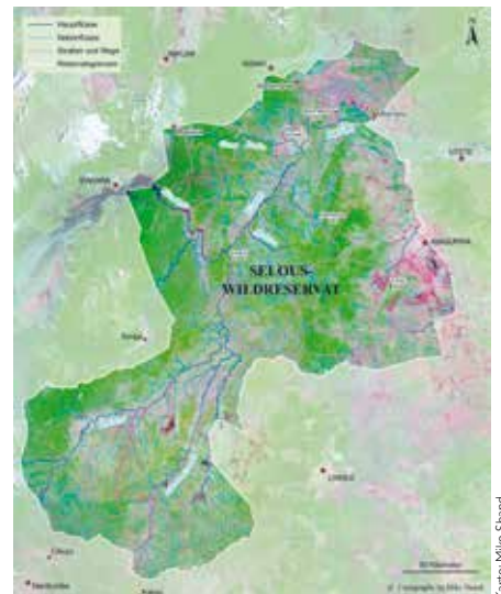
Karte: Mike Shand

nen von mir und anderen Beamten in einem Strassendorf an der Strasse von Tunduru