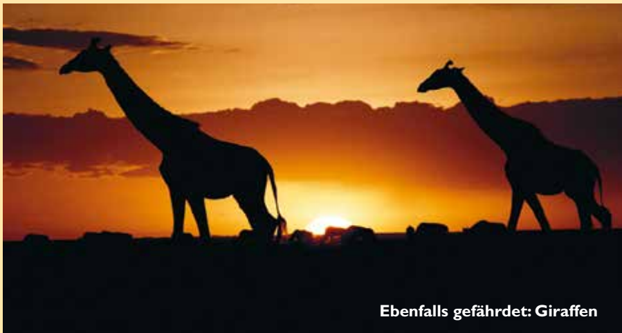
Ebenfalls gefährdet: Giraffen