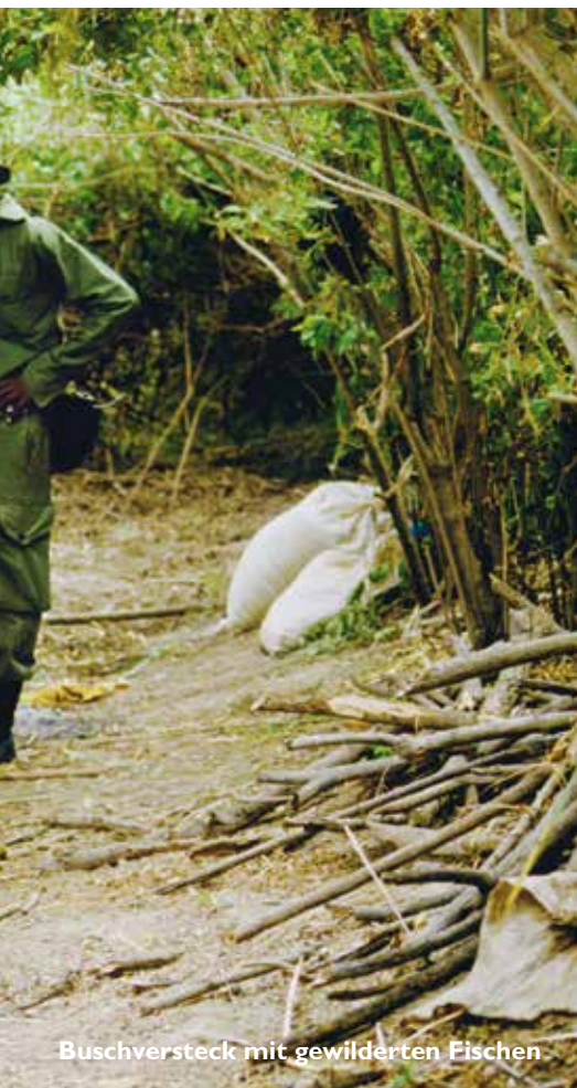
Buschversteck mit gewilderten Fischen

Repetierbüchsen – samt Munition aus. In den Achtzigerjahren wurde uns klar, dass etwas dagegen geschehen musste. Nur im Busch hinter den Wilderern her-zulaufen, um sie zu erwischen, war nicht Erfolg versprechend. Doch wie den Trend umkehren? Es bedurfte der Anregung und Unterstützung aus dem Ausland, um die Einheimischen in den Wildschutz einzu-beziehen. In Partnerschaft mit der deut-schen Entwicklungshilfe, konkret mit der «Deutschen Gesellschaft für Technische Zusammenarbeit», gründete die tansa-nische Regierung schliesslich im Jahre 1988 das «Selous Conservation Programme (SCP)». Ziel war es, die materiellen Inter-essen der Menschen mit dem Schutz der Wildtiere in Einklang zu bringen. Wir beriefen öffentliche Versammlungen ein, führten Befragungen, Dialoge und Diskussionen mit der Bevölkerung durch. Wir versuchten, die Mittelsmänner des Elfenbeinhandels durch Vermittler zwischen Dorfgemein-schaften und Wildschutz zu ersetzen. De-ren Aufgabe war, als Moderatoren für den Dialog mit den Dorfgemeinschaften zu wir-ken und gemeinsam mit ihnen zu planen, wie die Wilderer des Dorfes zu wirksamen Managern der natürlichen Ressourcen ihrer Gegend, insbesondere der Wildtiere, werden konnten.