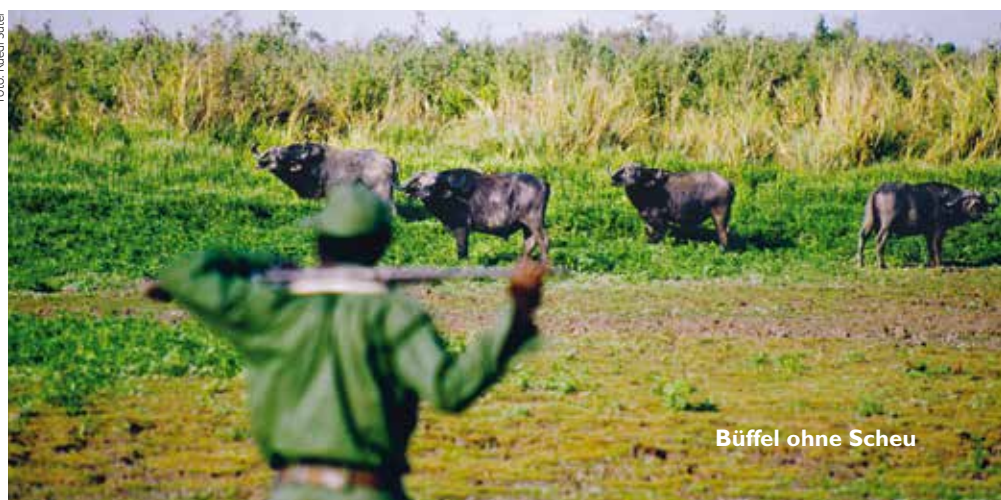
Büffel ohne Scheu

dukten. Heute unterscheidet man gerne zwischen Wilderei für den Eigenbedarf (gut) und kommerzieller Wilderei (schlecht), aber tatsächlich gab es diese Unterscheidung kaum. Alles Wild hatte immer einen Marktwert und wurde entweder gegessen oder verkauft, je nach dem Bedürfnis des Jägers. Der Dorf-Mrumba war beides: Er ass, bis er satt war,