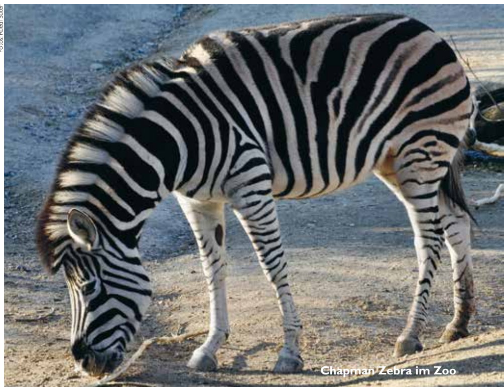
Chapman Zebra im Zoo