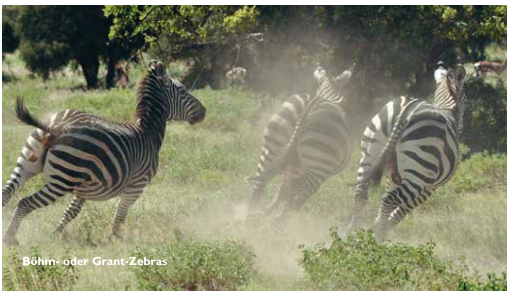
Böhm- oder Grant-Zebras