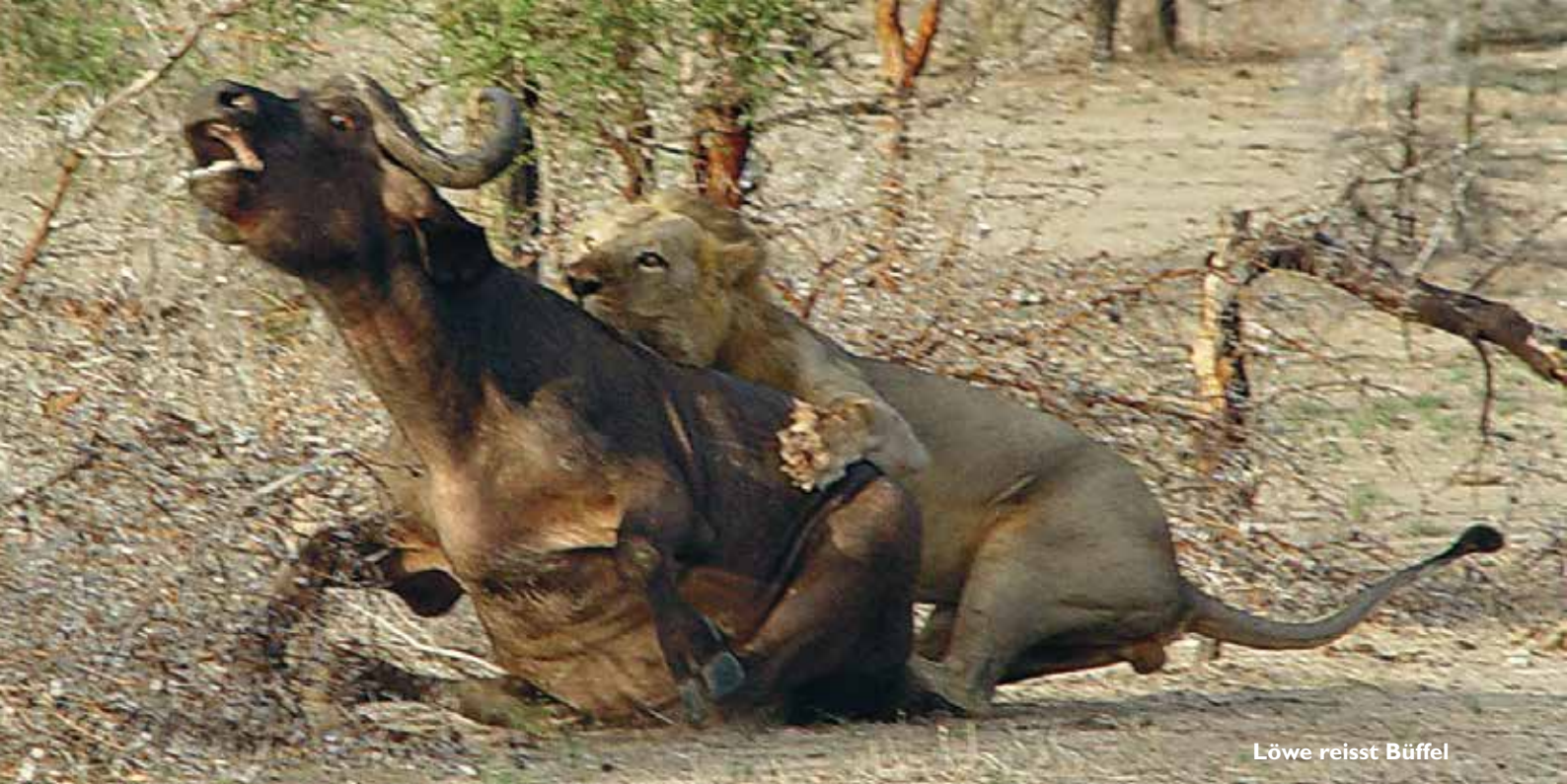
Löwe reißt Büffel