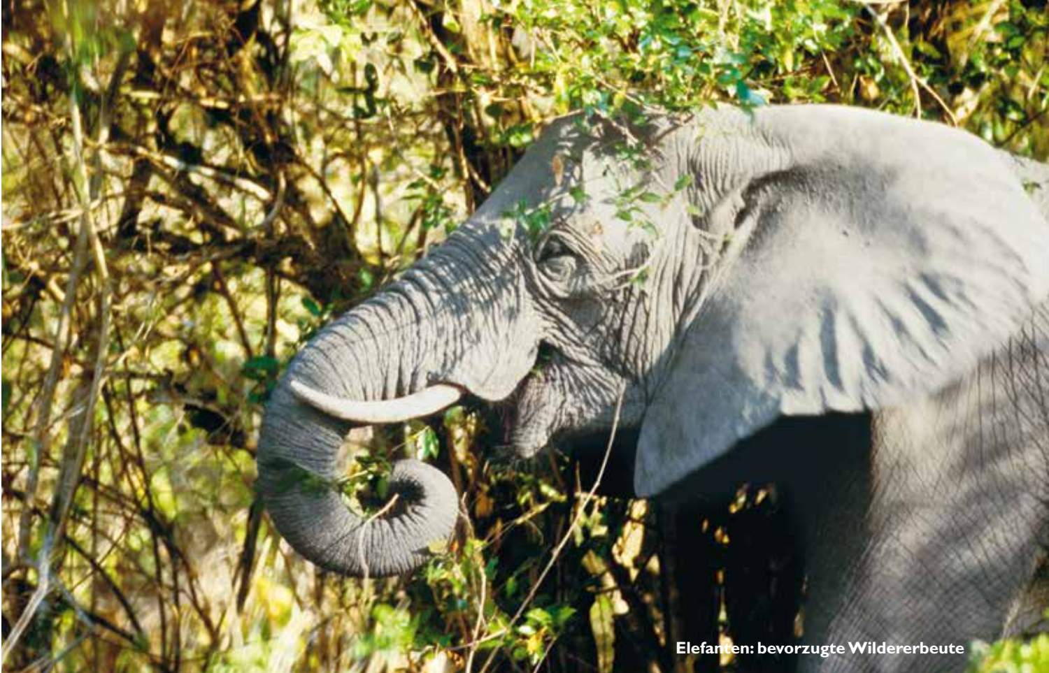
Elefanten: bevorzugte Wildererbeute

Rolf Baldus im Selous Conservation Programme (SCP) angestellt und arbeitete dort bis zu seinem Tod 2001. Er war mit uns auf vielen Patrouillen im Selous-Gebiet unterwegs. Seine Kenntnis des Geländes war verblüffend. Erstaunlicherweise lernte er es nie, richtig zu schießen, vermutlich weil er mit Speeren und Schlingen aufgewachsen war.